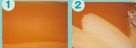
通常洗剤では落ちない喫煙室のヤニ汚れ

洗浄液をたっぷり含ませて拭き取るだけで簡単にヤニが落ちます!コツは本剤を通常より多めに入れることです。タバコのヤニの臭いも取れ、除菌もできます!※壁紙の材質によっては落ちにくい場合があります。