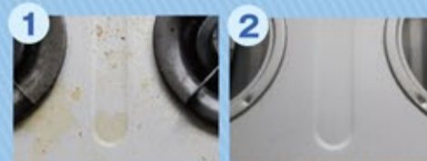
落ちにくい油污れ

コンロの天板や周りの汚れは、洗浄液を含ませて拭きます。頑固な汚れにはスプレーで吹き付け、しばらく置いて拭き取ります。五徳や魚焼きグリルなど、外せるものはつけ置き洗い(換気扇洗浄同様)で手軽にきれいになります。