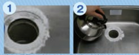
排水口周囲に本剤をまく

熱に弱い素材は取り外して排水口のまわりに本剤をまき、沸騰したお湯をゆっくり回しかけると、発泡しながら流れてパイプ内を洗浄します。シンクのそうじも洗浄液を含ませたスポンジで軽くこするだけでピカピカ!同時に除菌もできて安心です。