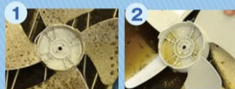
油べつりの換気扇が

シンクか大きめの容器にお湯(50~60℃)を入れ、本剤を溶かして2時間から一晩つけ置きします。(湯温が高いほど効果が上がりますが、熱湯の取扱にご注意ください)※換気扇が取り外せない場合スプレー容器に40℃前後のお湯ときれいっ粉を入れ、直接吹きつけながら拭き取る。