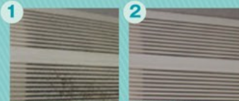
カビやホコリで不衛生なエアコン