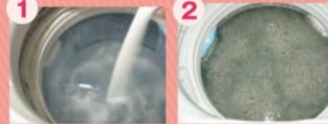
本剤を投入し、洗いを実行

①本剤を入れて5分ほど運転し、そのまま2~3時間置く。 ②カビや石鹸カスなどはがれた汚れをネットですくい取り、また数分運転して汚れを取り除くという作業を汚れが出なくなるまで繰り返す。 ※洗濯機の耐久温度をご確認ください。